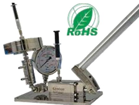
押出機が付くホモジナイザ