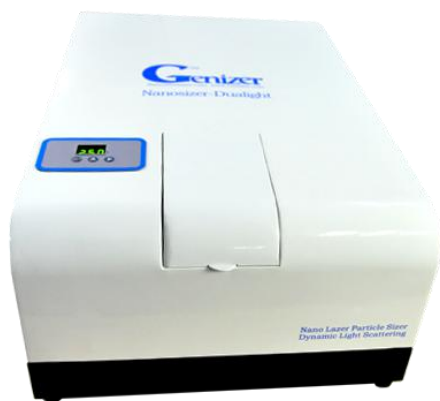
双激光纳米粒度仪